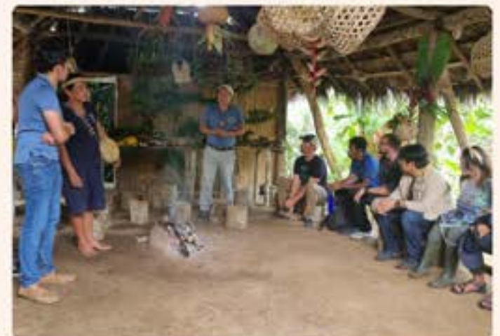
Foto: Recorrido por la chakra ancestral Kichwa en PKR - TNC