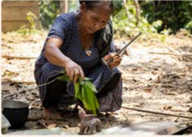
Foto: Mujer Kichwa - TNC

TNC está llevando a cabo iniciativas que combinan bienestar humano, conservación y sostenibilidad , que incluyen la protección de ecosistemas de agua dulce y terrestres , el desarrollo de mecanismos comunitarios para su manejo, la creación de oportunidades económicas sostenibles y el fortalecimiento de capacidades . El objetivo es acompañar los esfuerzos de conservación que realizan los pueblos indígenas y las comunidades locales buscando una gestión sostenible de los recursos .